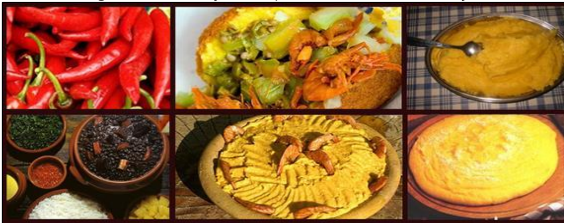
Figura 3 - Contribuições dos povos Africanos na Alimentação