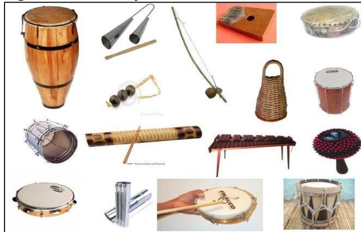
Figura 4 - Contribuição dos Povos Africanos na Música