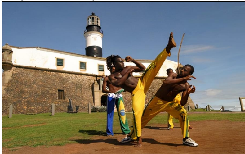
Figura 2 - Contribuição dos Povos Africanos no Esporte