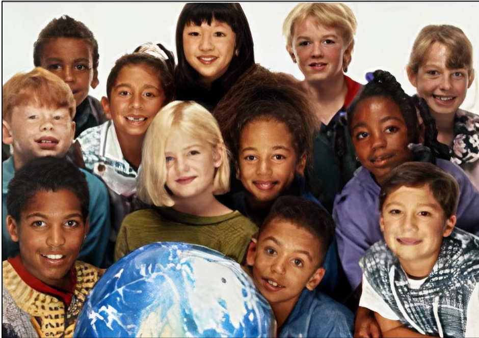
Figura 1 - Grupos Étnicos que Compõem a Nação Brasileira