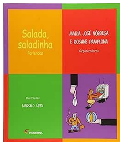
Figura 8 – Capa do livro Salada, saladinha