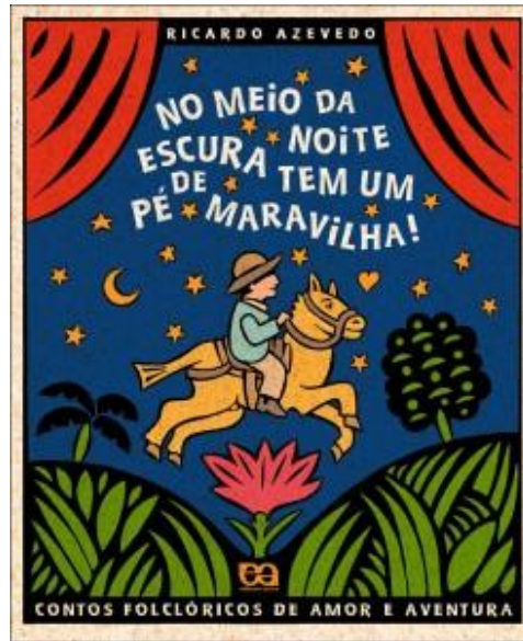
Figura 18 – Capa do livro No meio da noite escura tem um pé de maravilha!