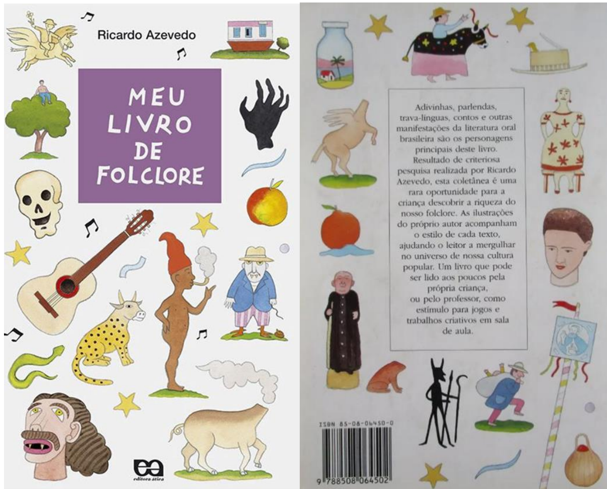
Figura 15 – Capa e contracapa do livro Meu Livro de Folclore