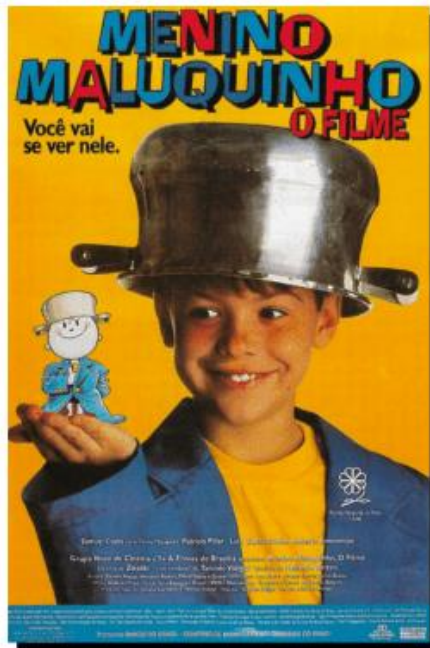
Figura 2 – Pôster do filme Menino Maluquinho