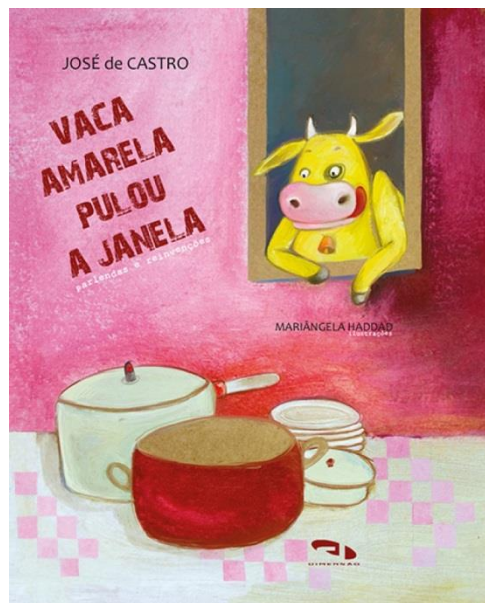
Figura 3 – Capa do livro Vaca amarela pulou a janela