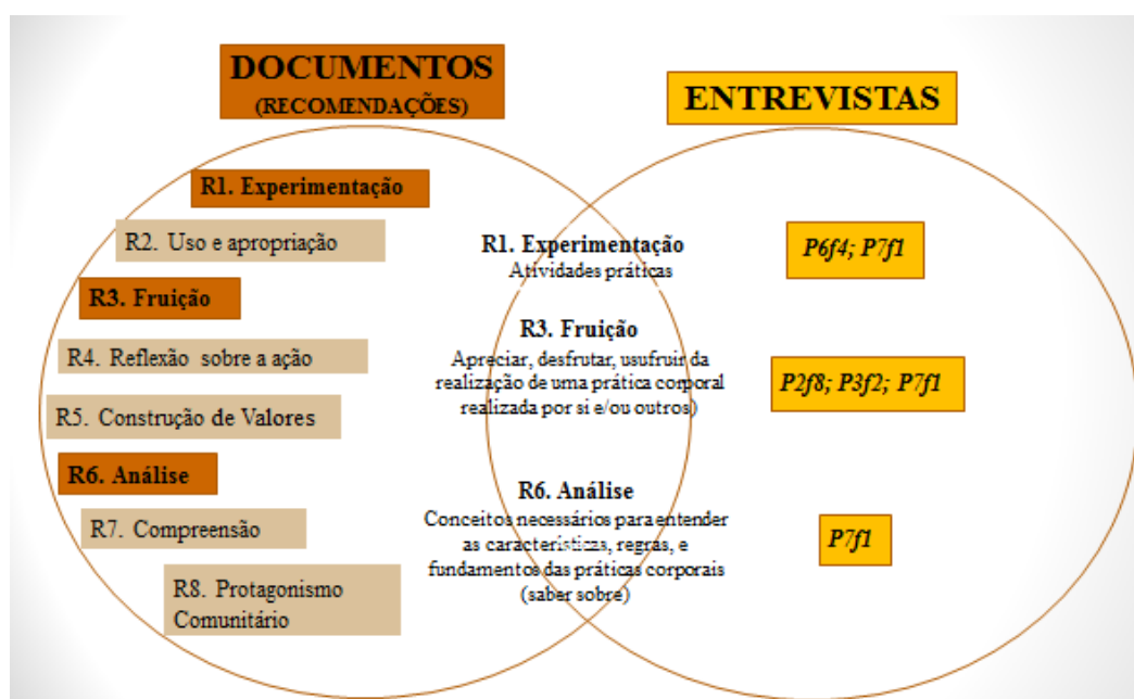
Diagrama 2 – Intersecção entre as recomendações dos Documentos e as Entrevistas

Não foi possível extrair trechos com informações que pudessem ser vinculadas às categorias Uso e Apropriação, Reflexão sobre a ação, Construção de valores, Compreensão e Protagonismo comunitário, como mostra a intersecção realizada no Diagrama 2.