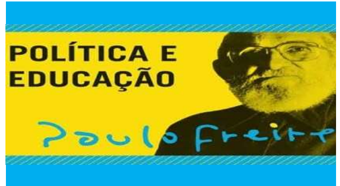
PAULO FREIRE – PALESTRA – POLÍTICA E EDUCAÇÃO – 1993.