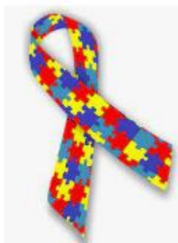
Figura 1 – Símbolo do autismo