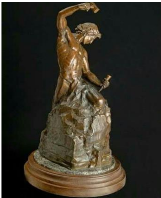
Figura 2 - Self Made Man , de Bobbie Carlyle

PROFESSOR@, a partir desses textos, você pode pedir aos alunos que façam novas atividades de interpretação, por exemplo, que comentem a escultura ou que justifiquem o porquê de o samba ser considerado uma metalinguagem.