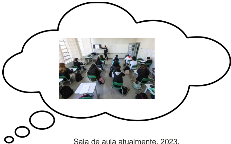
Sala de aula atualmente, 2023.