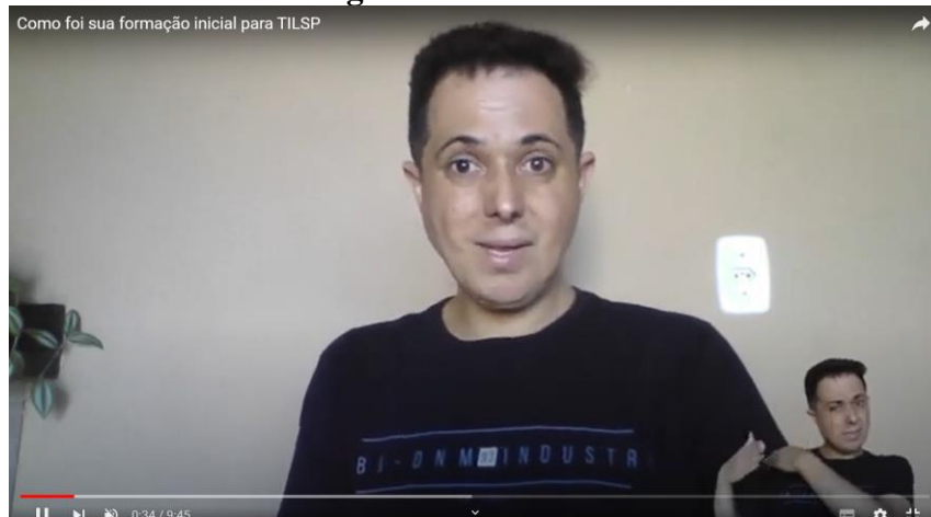
Imagem 02 – videoaula 01

Observações: No início do vídeo, a segunda videoaula é citada, mas esse é o primeiro conteúdo acerca de nosso estudo. Houve uma dificuldade de visualização na apresentação da apostila, mas não comprometeu o conteúdo do vídeo.