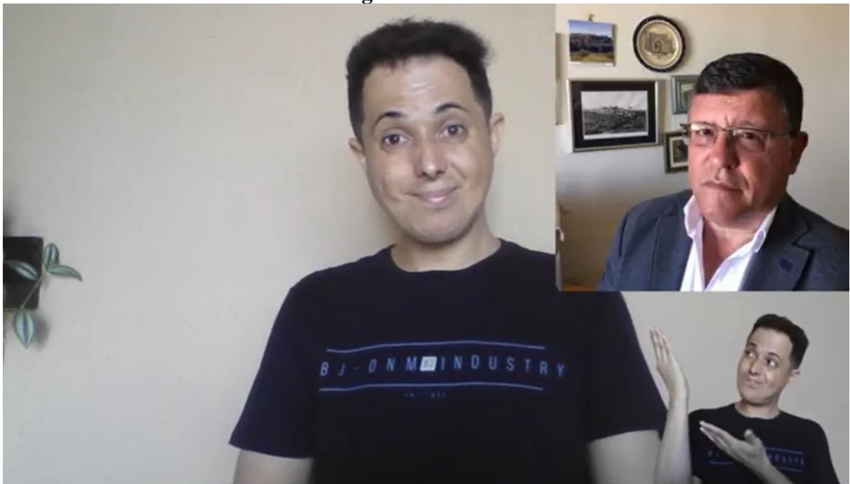
Imagem 01 – Abertura

Link para acesso ao vídeo: https://www.youtube.com/watch?v=XBruozpOGHo