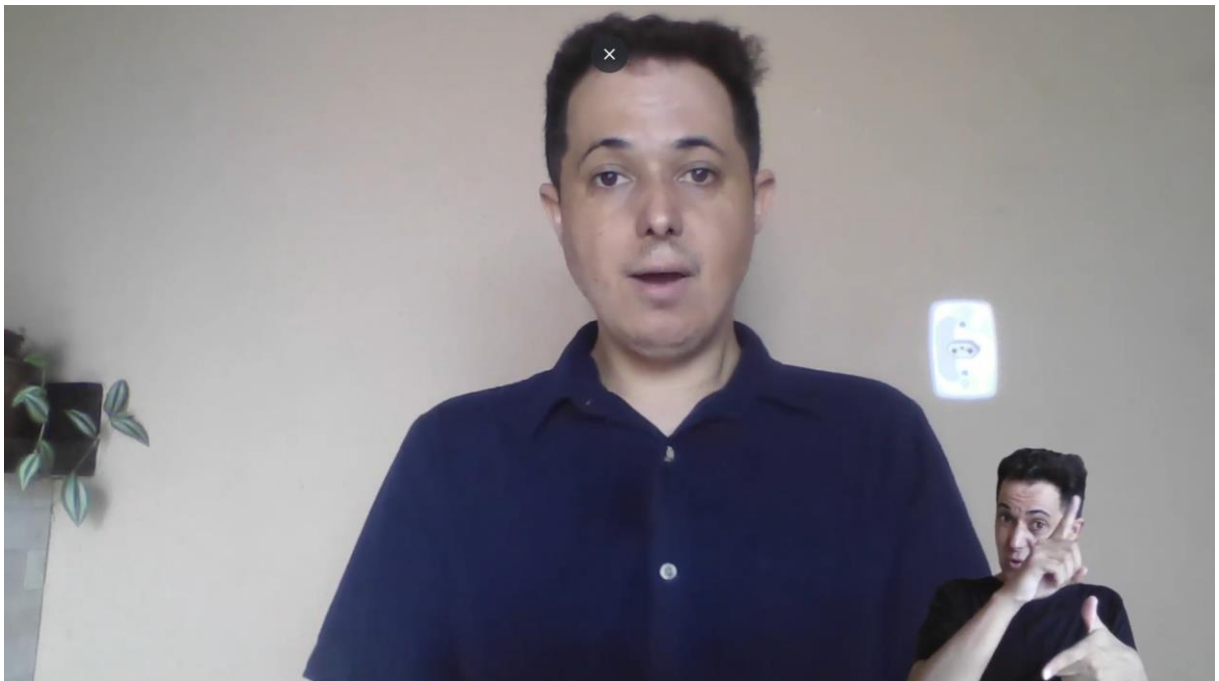
Imagem 05 – Dificuldades e problemas de tradução

Link para acesso ao vídeo: https://www.youtube.com/watch?v=7bB3KRHLVsk