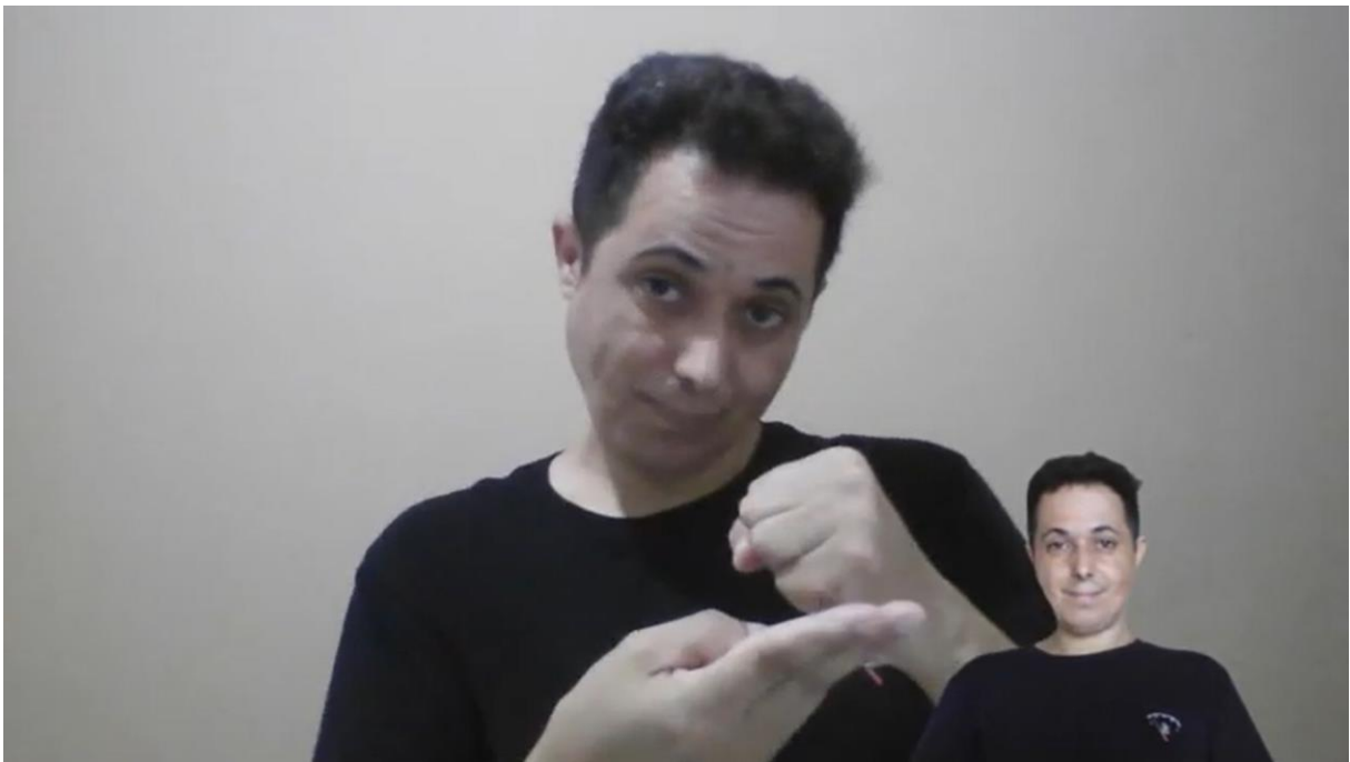
Imagem 11 – Sinal da UENP – Universidade Estadual do Norte do Paraná

Link para acesso ao vídeo: https://www.youtube.com/watch?v=ki8H3w3I3ys