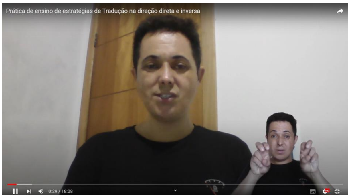
Imagem 13 – Prática de ensino de estratégias de tradução

Link para acesso ao vídeo: https://www.youtube.com/watch?v=ow-jifK4ECw