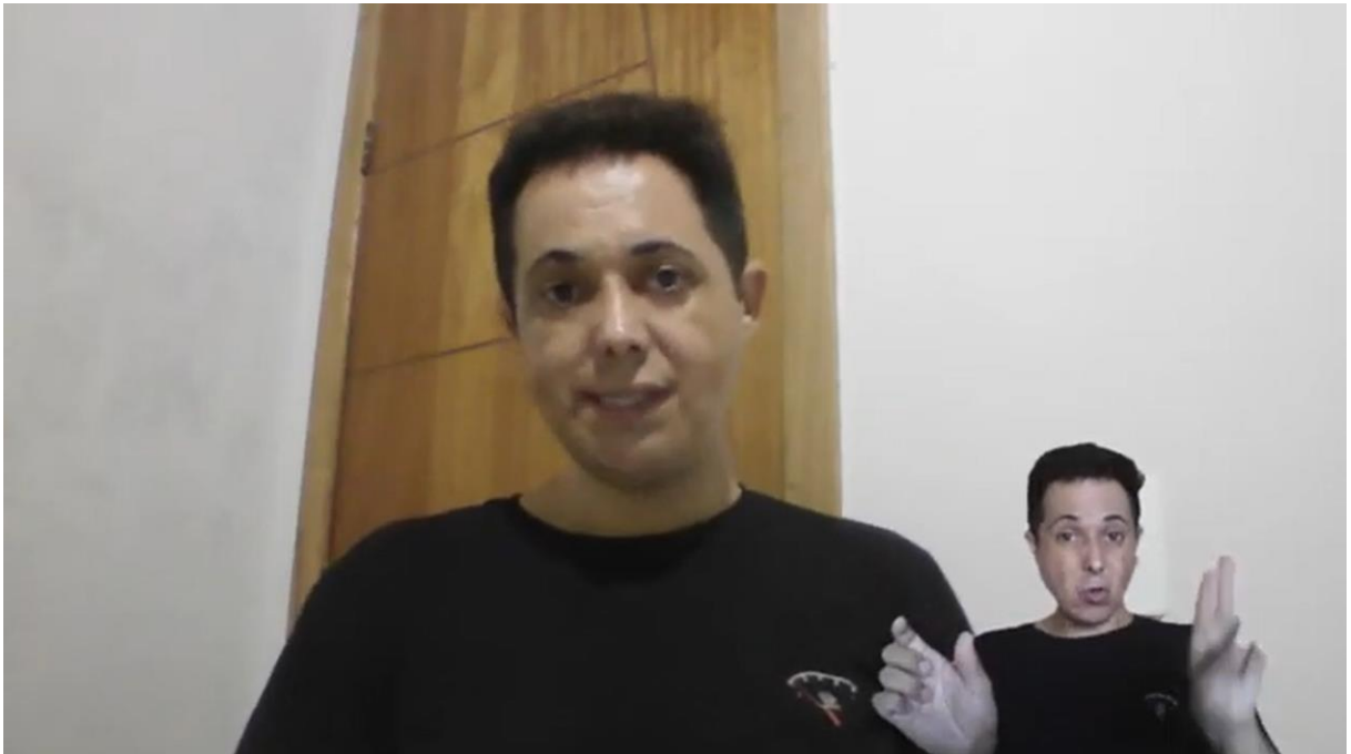
Imagem 12 – Como o TILSP seleciona suas escolhas tradutórias

Link para acesso ao vídeo: https://www.youtube.com/watch?v=_sRQhrndqsU