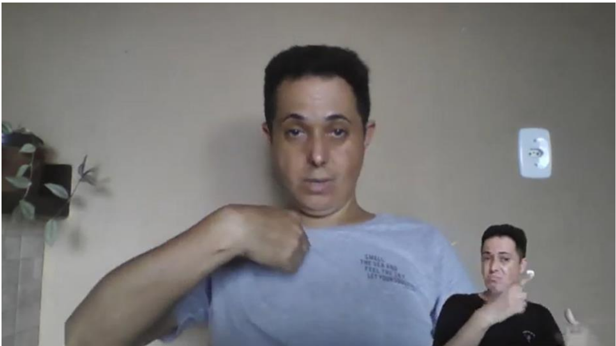
Imagem 10 – Ensino da tradução palavra por sinal/Palavra por palavra

Link para acesso ao vídeo: https://www.youtube.com/watch?v=7Au67Y3i9_4