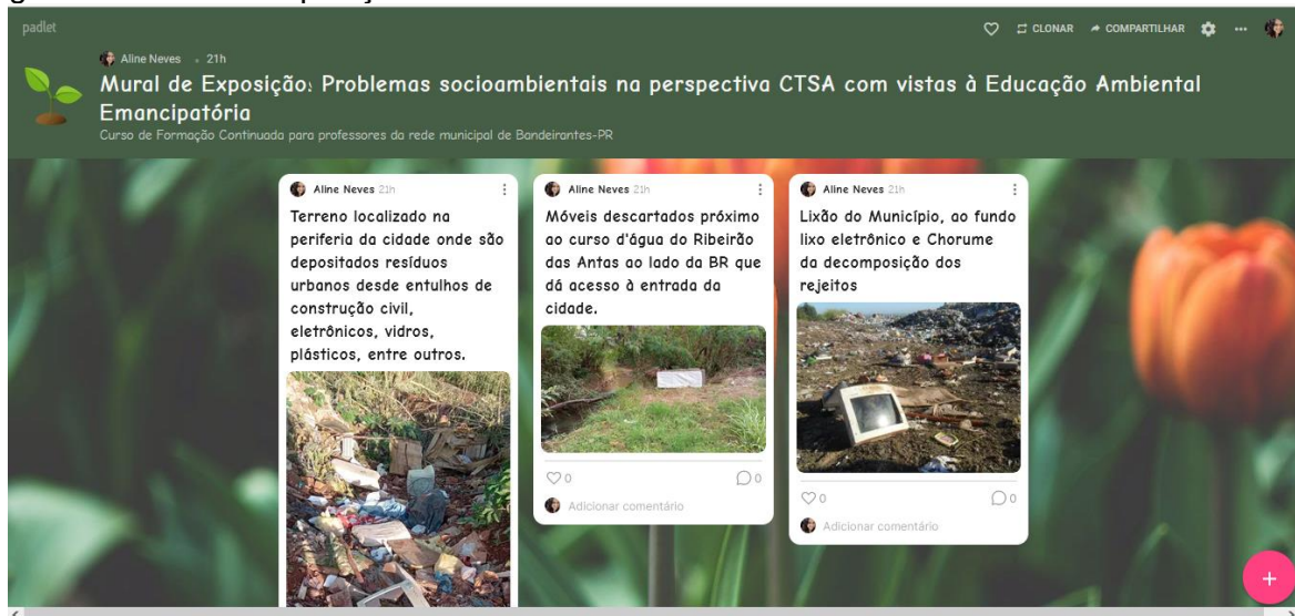
Figura 2 - Mural de exposições na Plataforma Padlet