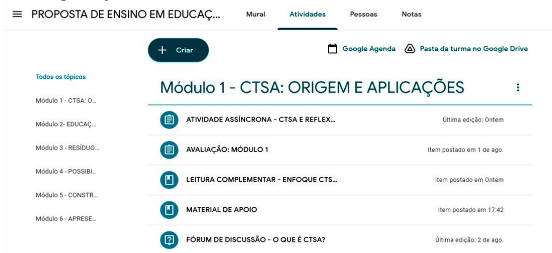
Figura 3 - Organização das atividades: 1º Módulo 1 do curso

Na Plataforma de ensino e aprendizagem Google Classroom foram organizados os módulos com as atividades assíncronas, materiais de apoio, leituras complementares e fóruns de discussão, a fim de orientar o processo formativo e tornar mais dinâmica a interação entre o grupo.