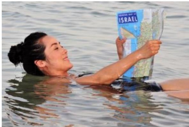
Figura 1. https://brasilecola.uol.com.br/geografia/mar-morto.htm

Mulher divertindo-se nas águas do Mar Morto, nas quais não é possível afundar.