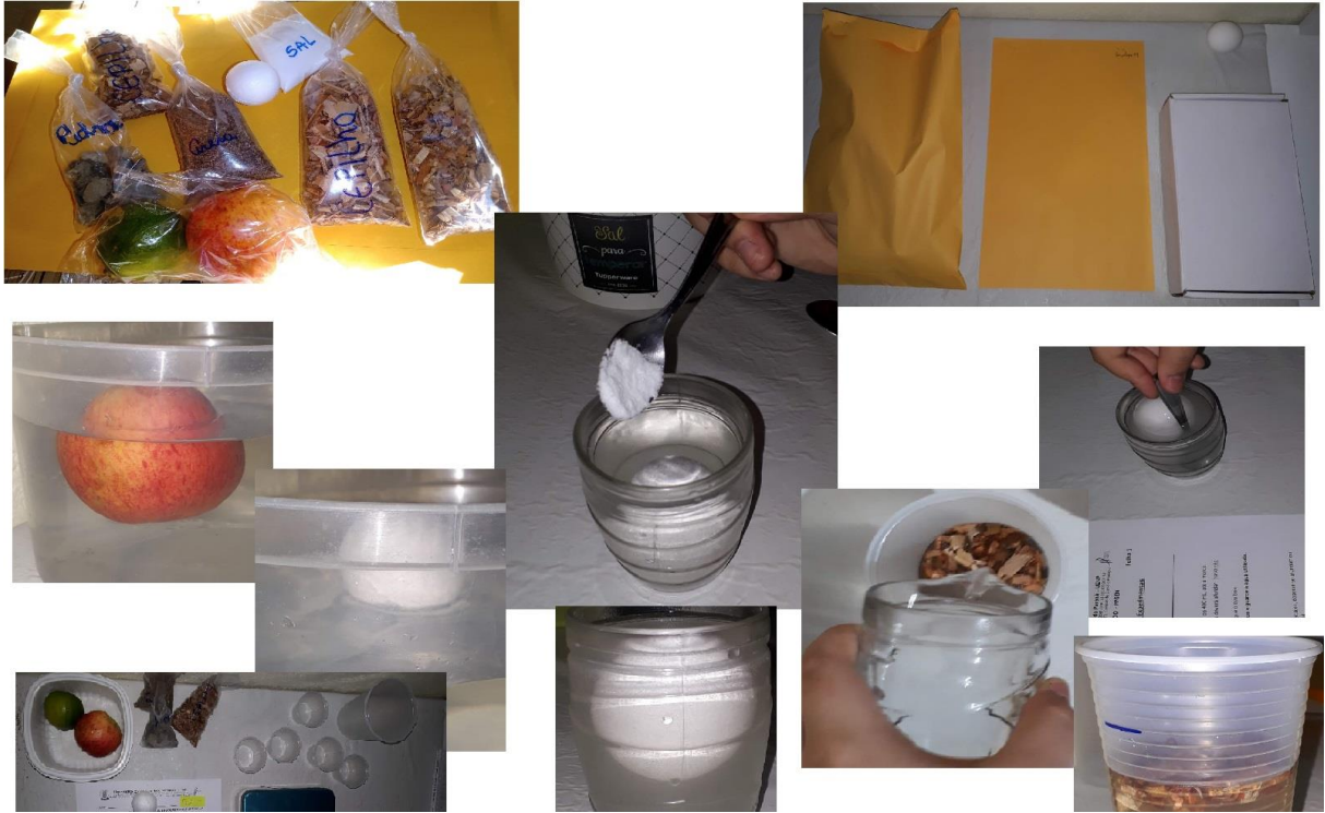
Figura 3 - Fotos realizadas pelos alunos durante as atividades experimentais