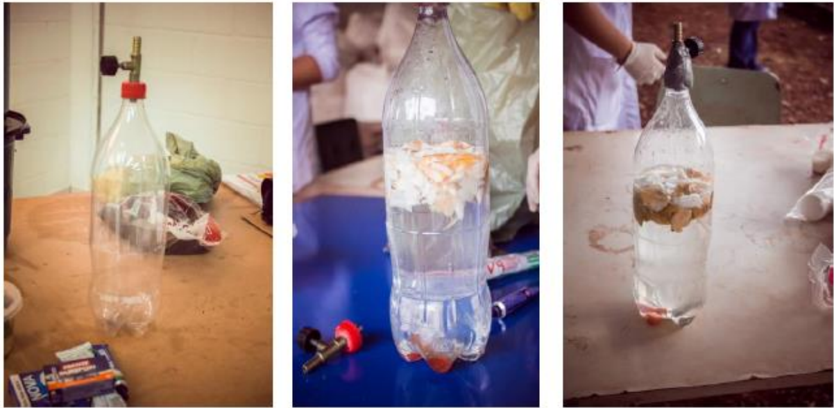
Figura 13 – Adição de insumos orgânicos ao biodigestor

Concluída essa fase de montagem do protótipo do biodigestor portátil, é momento para a inserção dos insumos no biodigestor. Inicia-se com a inserção da fase líquida, pois, conforme indicado na literatura é necessária uma proporção da fase de 30:1 para promover mais facilmente a primeira etapa da anaerobiose, que é a hidrólise (quebra das ligações das moléculas maiores por meio da água e oxidação à produtos menores), conforme apresenta a figura 13.