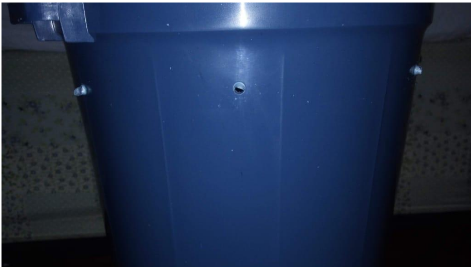
Figura 7 – 01ª Etapa da construção da composteira

A produção da composteira caseira seguiu algumas etapas, conforme serão descritas a seguir com as imagens de cada uma das etapas.