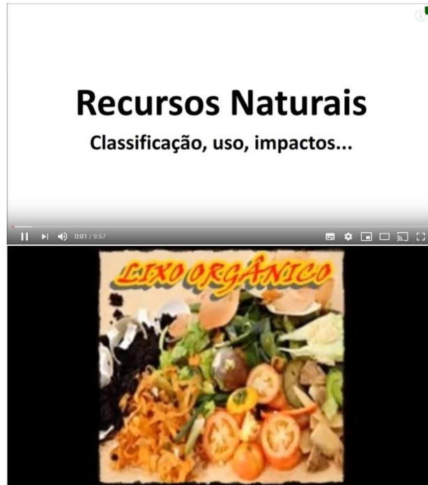
Figura 4 – Vídeos 1 e 2