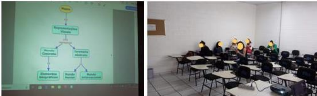
Figura 3 – Aplicação do 01º encontro

A seguir é apresentada uma imagem com uma parte do nivelamento e da primeira etapa desta aplicação na qualidade de exemplificação de aplicação.