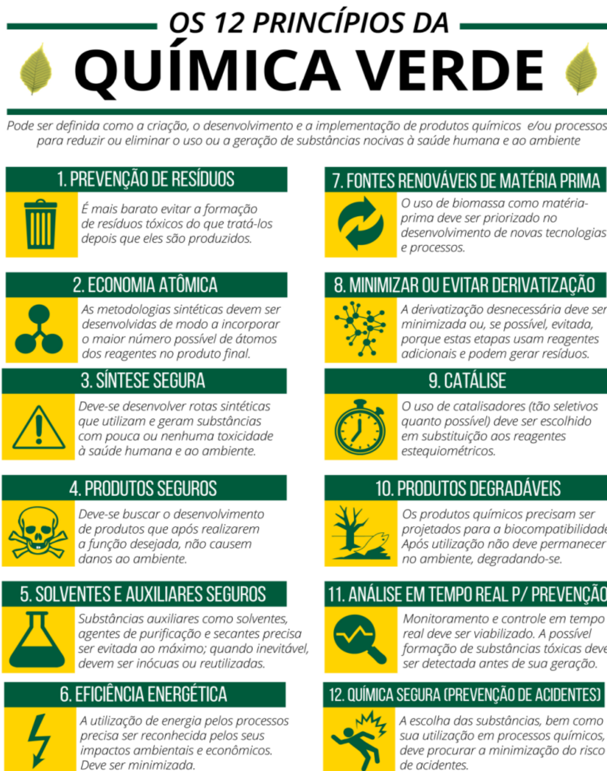
Figura 6 – A Química Verde em seus 12 princípios.