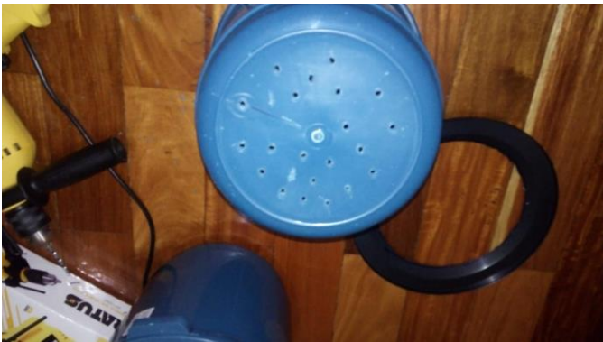
Figura 9 – 02ª etapa da construção da composteira, conclusão do processo de furação para a composteira.