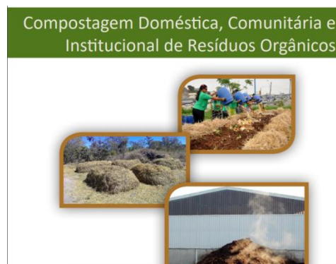
Figura 5 – Impresso acerca da compostagem e do biodigestor

Em seguida, a Figura 5, que vem acompanhada pelo texto do Ministério do Meio Ambiente, que pode ser trabalhado ou apenas impresso junto com os princípios que se seguem na Figura 6. Nesta sequência, foi aplicada a explicação dos conceitos da Figura 6 com a leitura dirigida dos processos de compostagem constantes na cartilha a seguir.