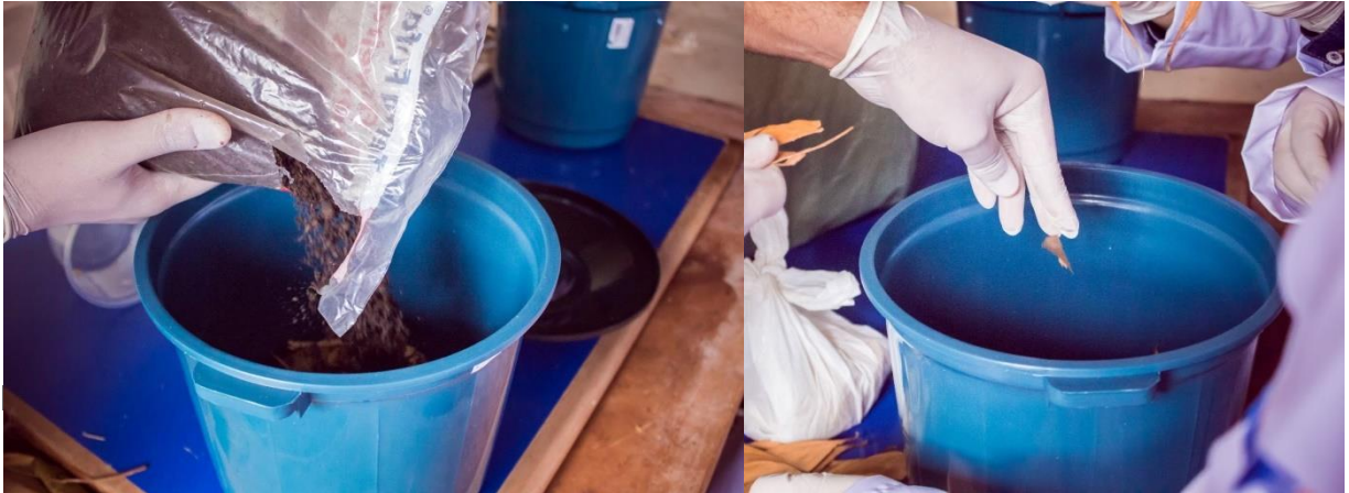
Figura 11 – Adição dos insumos na composteira

inclusive, que é necessário mexer em movimentos circulares as misturas borrifando um pouco de água que é para ajudar a compactação desse preparo, conforme a figura 11.