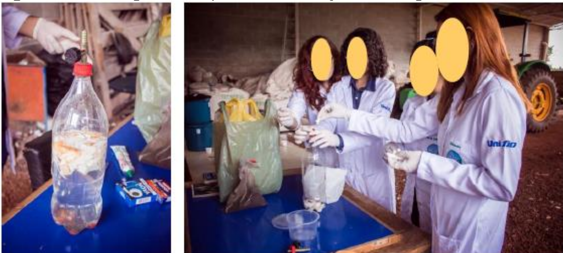
Figura 12 – Montagem do dispositivo de vedação do biodigestor.

A única etapa de preparação foi exatamente da fixação da válvula de abertura de gás na tampa da garrafa. Essa etapa deve ser executada de acordo com a figura 12, dispondo de apenas um único furo central na tampa utilizando a furadeira e broca de aço, concluindo com a cola de cano para a completa vedação. Deve-se informar ainda ao profissional docente que para vedação pode ser aplicada uma camada de massa vadante caso necessário.