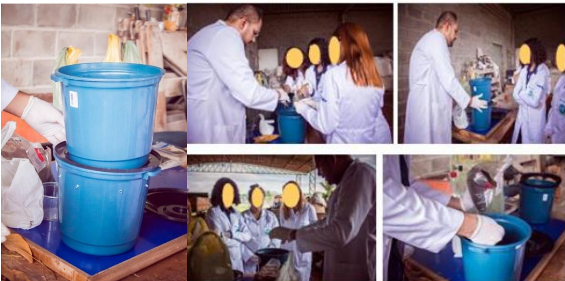
Figura 10 – 03ª Etapa da construção da composteira, montagem final.

Desse modo, conclui-se a montagem com a seguinte proporção, apresentada na Figura 10, 03ª etapa de construção, a montagem final, onde o balde de cima terá os fundos todos furados e o balde inferior servirá como coletor da fase biofertilizante líquida.