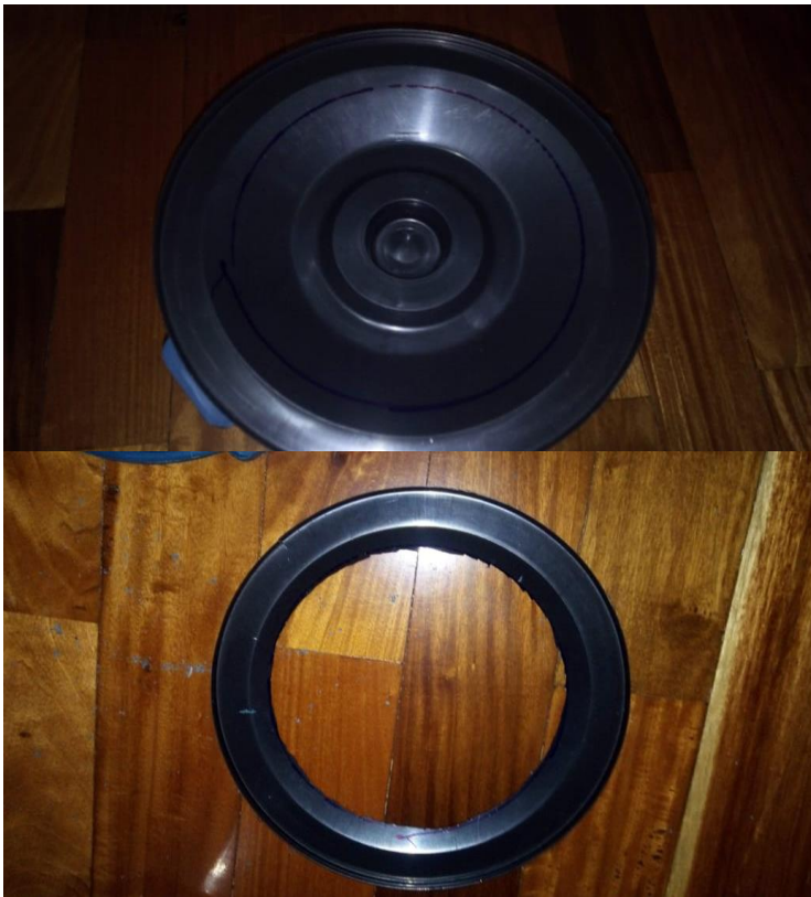
Figura 8 – 2ª Etapa da construção da composteira, corte da tampa do segundo balde.

Há de se observar que este processo deve ser feito pelo professor, e caso necessário, este pode solicitar a um profissional especializado ou ainda lançar mão de ferramentas diversas que auxiliem o desenvolvimento.