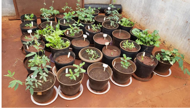
Figura 5 - Aspecto geral das culturas após 55 dias da sementeira