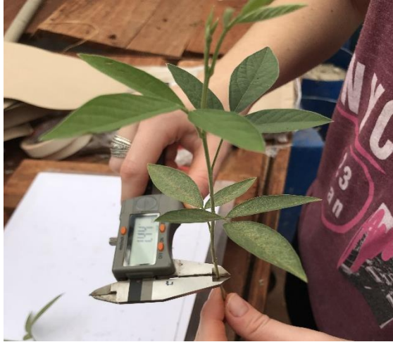
Figura 9 - Avaliação de Cajanus cajan quanto ao diâmetro.