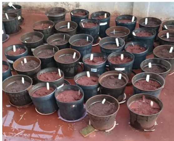
Figura 10 - Dia da semeadura da soja

Após 60 dias da retirada das fitorremediadoras, pode-se constatar mediante análise de rotina, que não foi necessária nova correção de solo, logo, realizou-se a adubação de P_2O_5 e K_2O em doses de 40 \text{ kg ha}^{-1} e a semeadura da cultura da soja ( Glycine max ), como planta bioindicadora, tendo em vista que a soja foi escolhida para mensurar os fatores de contaminação do experimento, pois é sensível aos herbicidas escolhidos e assim fornecer informações sobre o contaminante do solo através da avaliação. A irrigação do solo foi realizada para manter próxima à capacidade de campo, as Figuras 10 e 11 apresentam o experimento no dia e após 50 dias de semeadura da soja.