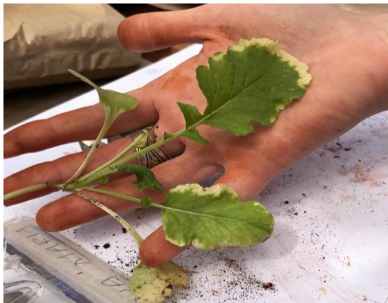
Figura 8 - Contagem das folhas da Brassica rapa sub. rapa .