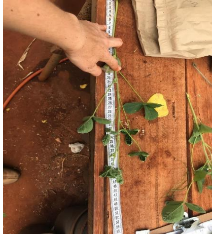
Figura 12 - Aferição quanto à altura de plantas.

f) Para a toxicidade visível das plantas fitorremediadoras, foi estabelecido um parâmetro de 0 (zero) a 10 para a análise visual, conforme o método utilizado por Procópio et al., (2008), desta forma, foi avaliada conforme a planta demonstrava sinais de injúria.