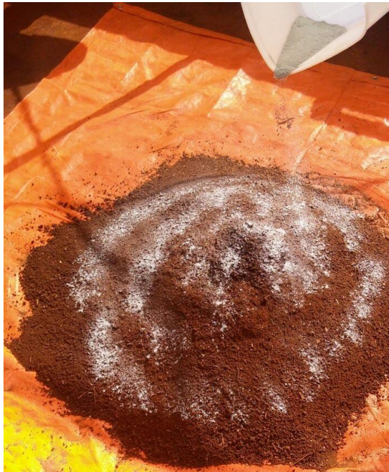
Figura 2 – Aspecto geral da aplicação do calcário