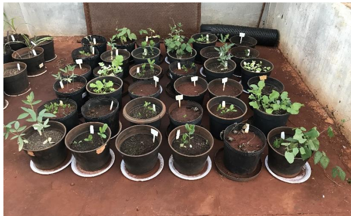
Figura 4 - Aspecto geral das culturas após 47 dias após a semeadura.