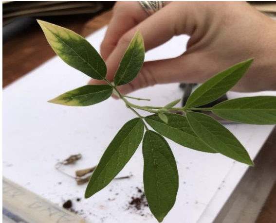
Figura 7 - Contagem das folhas de Cajanus Cajan .