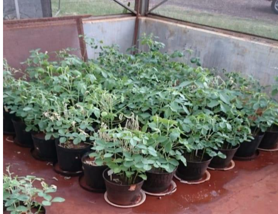
Figura 11 - Experimento aos 50 dias após semeadura da soja