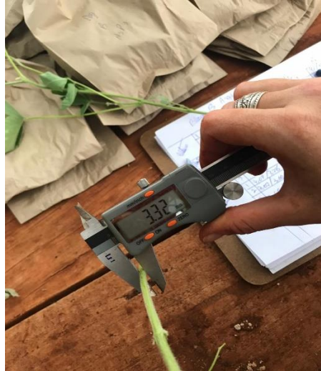
Figura 14 - Avaliação quanto ao diâmetro.