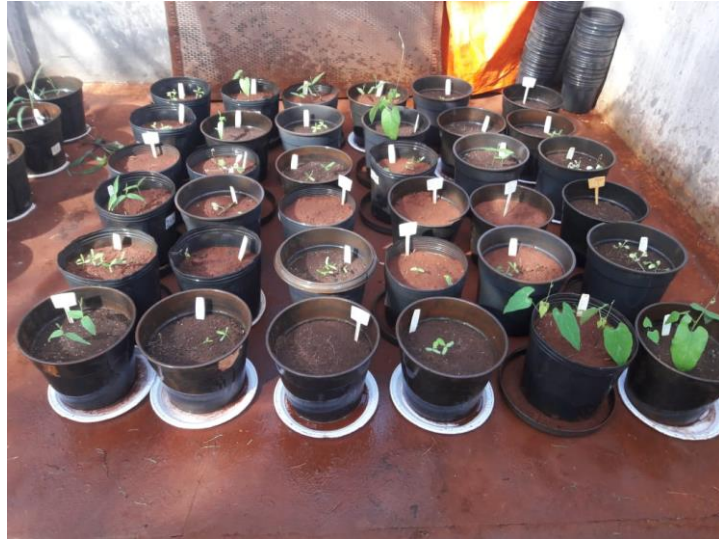
Figura 3 - Aspecto geral das culturas após 23 dias após a semeadura.

manter próxima à capacidade de campo para todas as culturas de adubos verdes, as Figuras 3, 4 e 5, apresenta o experimento com 23, 47 e 55 dias após a semeadura dos adubos verdes.