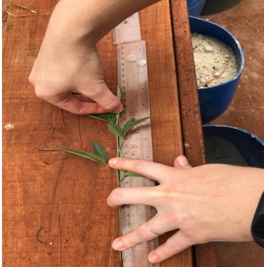
Figura 6- Avaliação da altura das plantas.