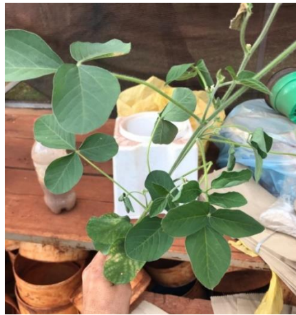
Figura 13 - Contagem das folhas da soja.