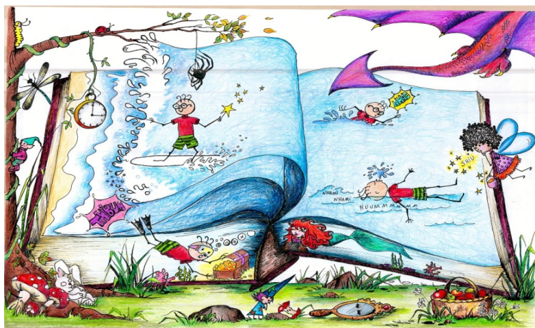
Figura 3 – Perguntas de terceiro nível