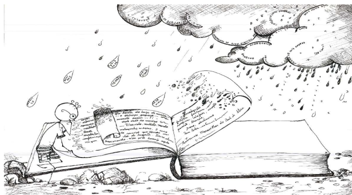
Figura 1 – Perguntas de primeiro nível