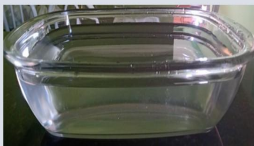
Densidade da água 1 \text{ g/cm}^3