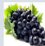
Densidade da uva 0.36 \text{ g/cm}^3