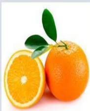
Densidade da laranja 0.5 \text{ g/cm}^3