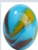
Densidade do vidro 2.5 \text{ g/cm}^3