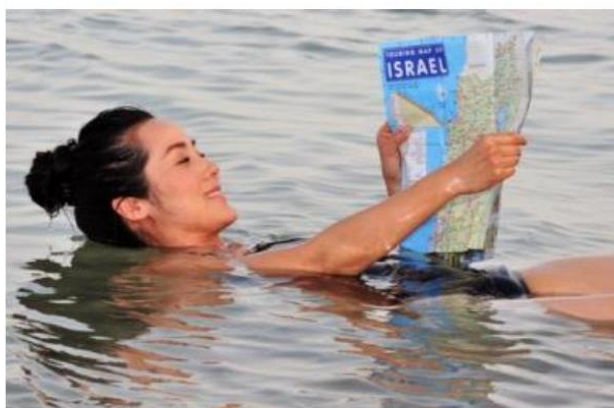
Figura 1. https://brasilecola.uol.com.br/geografia/mar-morto.htm

Mulher divertindo-se nas águas do Mar Morto, nas quais não é possível afundar.