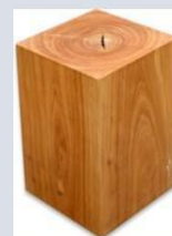
Densidade do eucalipto 0.83 \text{ g/cm}^3