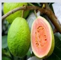
Densidade da goiaba 0.7 \text{ g/cm}^3