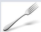
Densidade do inox 8.0 \text{ g/cm}^3