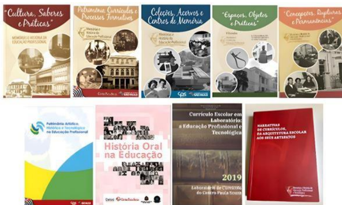
Figura 15 – Os livros institucionais da memória e história da educação profissional e tecnológica, difundidos no período de 2010 a 2021