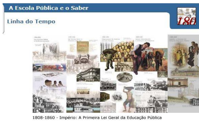
Figura 3 – A Escola Pública e o Saber: trajetória de uma relação.

A exposição buscou articular conhecimentos sobre a leitura escolar com informações sobre os tempos e espaços de escolarização, alunos e alunas presentes e ausentes da escola em diversos períodos históricos, utensílios e móveis utilizados nas unidades (em zonas urbanas e rurais) e a composição do quadro docente sob o prisma histórico. Esses elementos foram abordados nos diferentes níveis e modalidades de ensino. Mais do que levantar informações – tarefa facilitada pela experiência do grupo em estudos de História e História da Educação –, o grande desafio foi a sistematização gráfica e plástica desses dados.