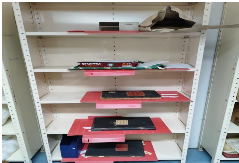
Figura 20 – Acervo NUMAH: espaço de higienização dos arquivos, livros reservados