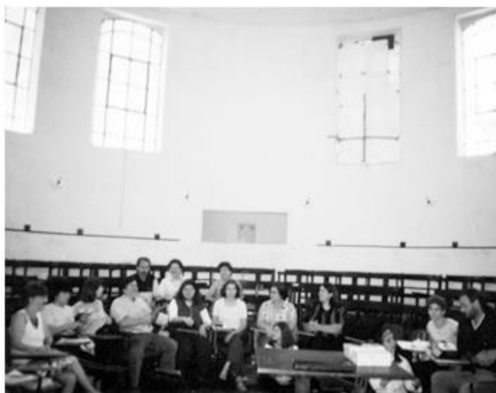
Figura 12 – Reunião de alinhamento com os professores que atuam nos Centros de Memória, no Arquivo Histórico da Cidade de São Paulo, em 2002