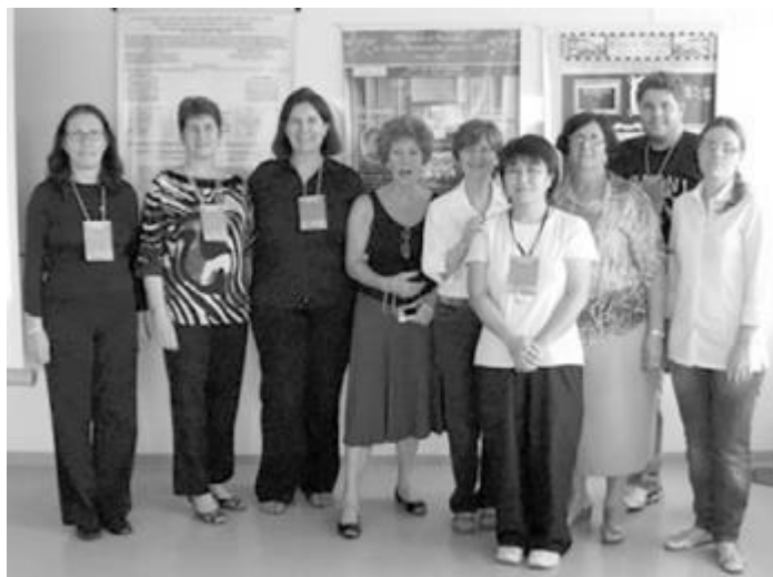
Figura 13 – Professoras presentes no I Encontro Memórias da Educação Profissional