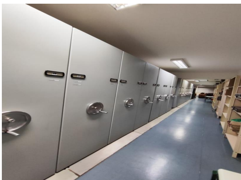
Figura 23 – Acervo NUMAH: reserva técnica, armários deslizantes

Os mobiliários relacionados à Escola Caetano de Campos, identificados por Patrícia Golombek, ex-aluna da instituição (São Paulo, 2009), incluem carteiras, relógios, representações anatômicas, uma estante de livros e a “estante do cineminha”, usada pelos alunos para apresentar curtas-metragens feitos com papel-cartolina.