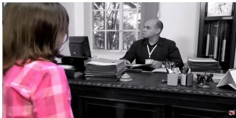
Figura 9 – Patrimônio em Rede