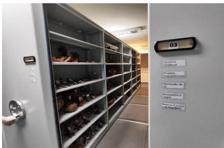
Figura 25 – Acervo NUMAH: reserva técnica, armários deslizantes nº 03