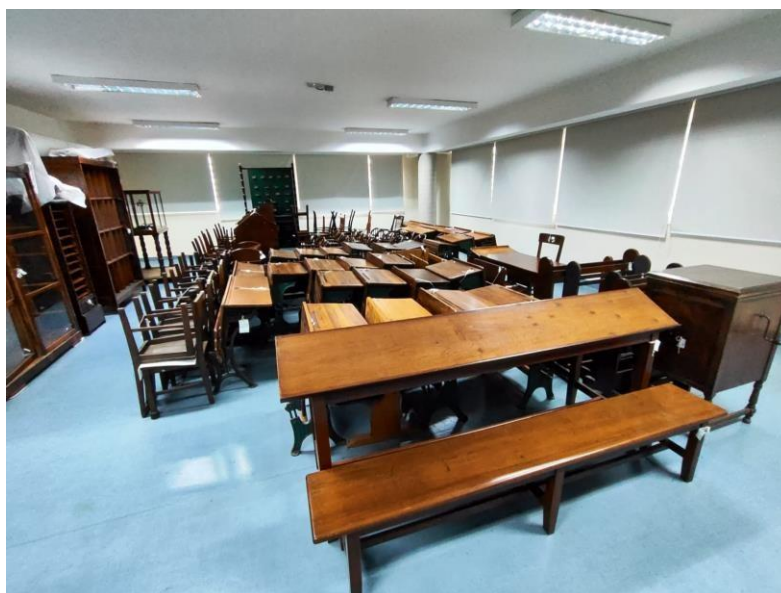
Figura 21 – Acervo NUMAH: reserva técnica, mobiliário Patrícia Golombek

As figuras relacionadas ao setor de higienização dos arquivos, especificamente a Figura 19, mostram os procedimentos adotados: na primeira mesa, ferramentas para higienização dos arquivos; ao lado, um saco de lixo acoplado para descarte do pó acumulado. Na mesma figura, outra mesa com placas de polionda evita que a sujeira se espalhe. A Figura 20 retrata os livros reservados para higienização.