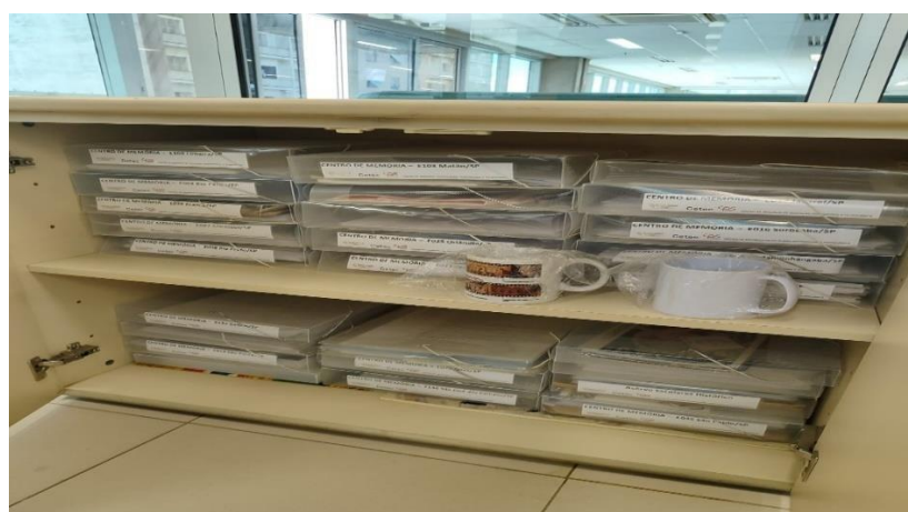
Figura 32 – Acervo do espaço administrativo CEETEPS, obras dos centros de memória