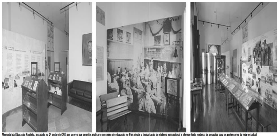
Figura 2 – Reportagem sobre o Centro de Referência Mario Covas

Memorial da Educação Paulista, instalado no 2º andar do CRE: um acervo que permite analisar o processo de educação no País desde a implantação do sistema educacional e oferece farto material de pesquisa para os professores da rede estadual