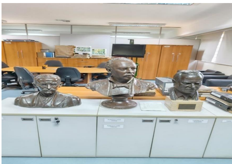
Figura 17 – Acervo NUMAH: espaço de consulta dos pesquisadores