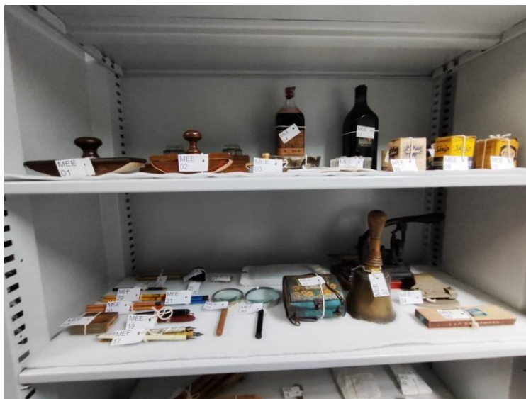
Figura 24 – Acervo NUMAH: reserva técnica, armários deslizantes, materiais de escritório