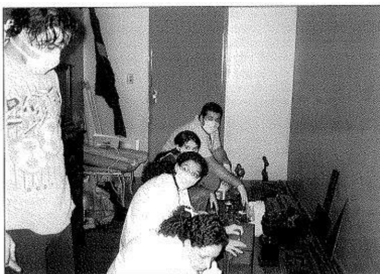
Reconhecimento e primeira higienização de peças museológicas no mutirão de professores do Projeto e alunos voluntários, na ETE Carlos de Campos.