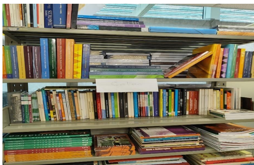
Figura 30 – Acervo do espaço administrativo CEETEPS, CGD