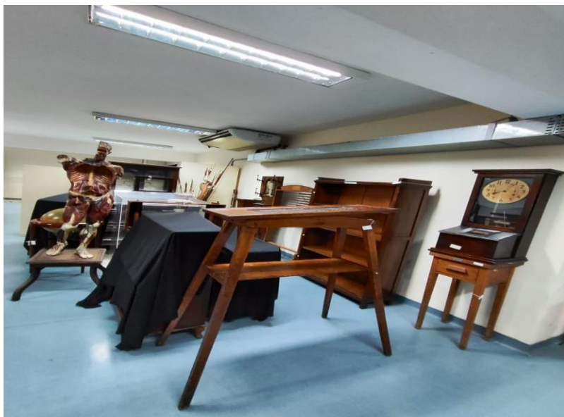
Figura 22 – Acervo NUMAH: reserva técnica, mobiliário Patrícia Golombek