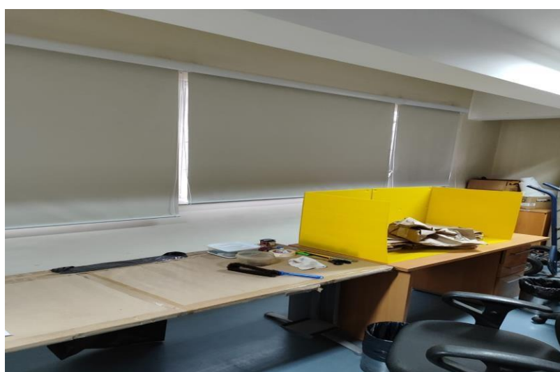
Figura 19 – Acervo NUMAH: espaço de higienização dos arquivos