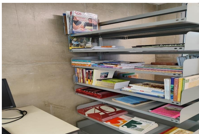
Figura 28 – Acervo do espaço administrativo CEETEPS, livros institucionais