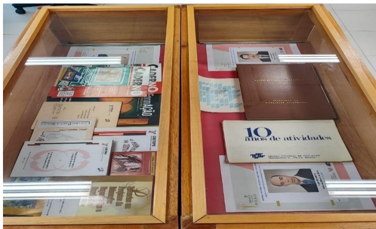
Figura 31