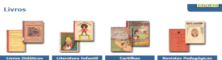
Figura 7 – A Escola Pública e o Saber: os Livros Didáticos