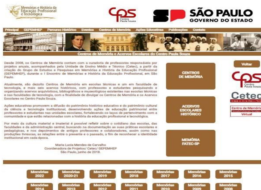
Figura 14 – Hospedagem virtual de Memórias e História da Educação Profissional e Tecnológica