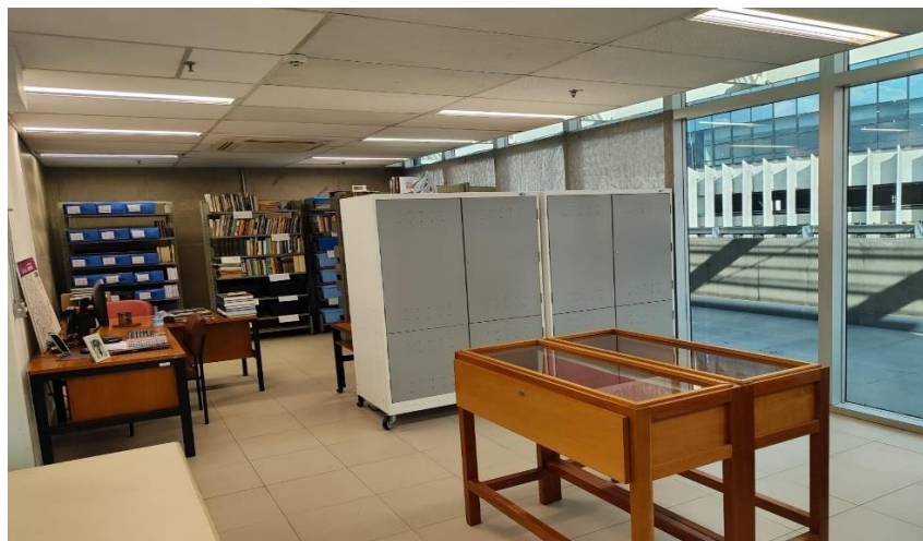
Figura 27 – Acervo do espaço administrativo do CEETEPS