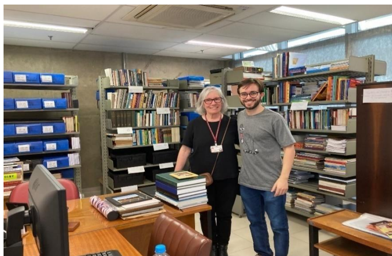
Figura 34 – A coordenadora e o pesquisador