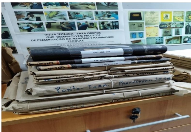
Figura 18 – Acervo NUMAH: espaço de consulta dos pesquisadores, alguns dos materiais consultados