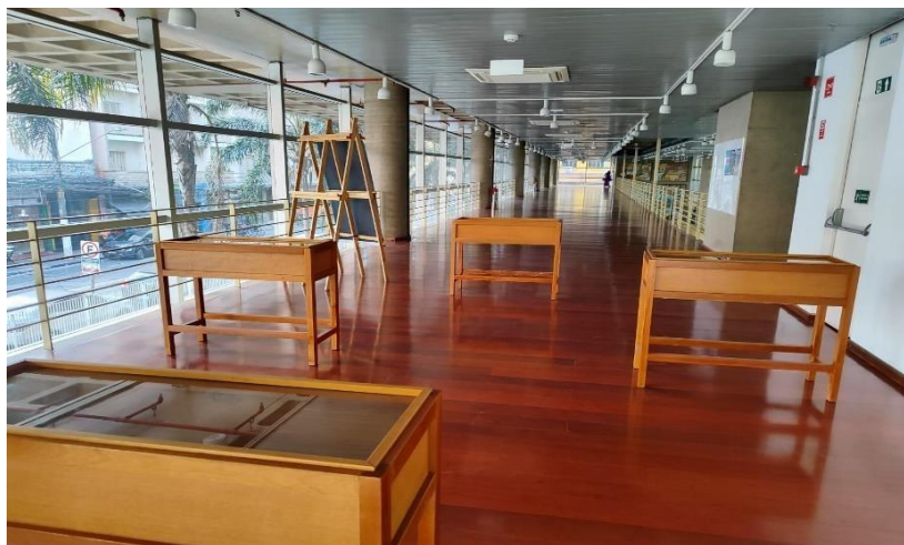
Figura 33 – Espaço expositivo do CEETEPS