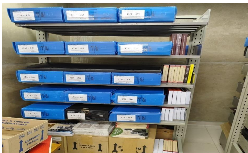
Figura 29 – Acervo do espaço administrativo CEETEPS, Doroti Quiomi Kanashiro Toyohara, arquivo pessoal