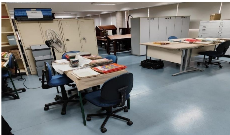
Figura 26 – Acervo NUMAH: reserva técnica, acervo Maria Aparecida Magnani

Destacam-se as Figuras 24 e 25, que mostram o setor número 03, contendo materiais e brinquedos escolares, projetos arquitetônicos e até armamentos utilizados durante a Revolução de 1932. A Figura 24 exhibe materiais, como tintas, carimbos, canetas, lupas e um sino.