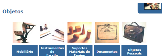
Figura 8 – A Escola Pública e o Saber: os Objetos